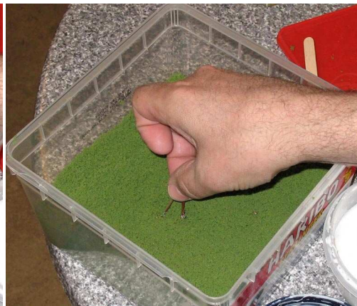
Ned i bladene.