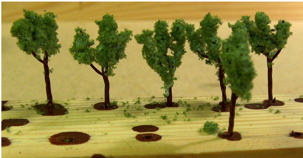
Det færdige resultat inden udplantning.