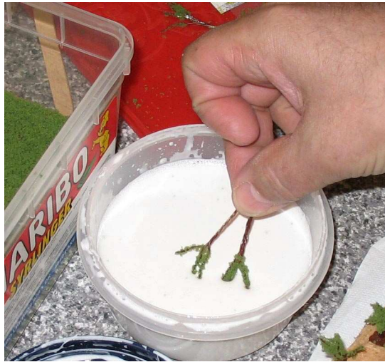
Grene i limblanding

Når malingen er tør dyppes grenenden i trælim fortyndet med vand. Derefter er det hurtigt over i kassen med "blade" (grønt smuld i den rigtige farve) og retur til tørring i træholderen.