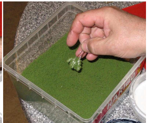
Og op igen, overskydende grønt rystes af.